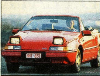
Ab 1991 in Serie: das Volvo 480 ES Cabrio. Hier der Prototyp von EBS

Auch wenn sie es noch nicht zugeben: Volvo baut wieder ein Cabriolet. Auto Bild hat es sogar schon gefahren