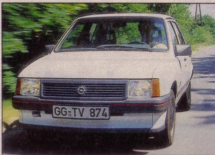
Opel Corsa 1.5 D Swing