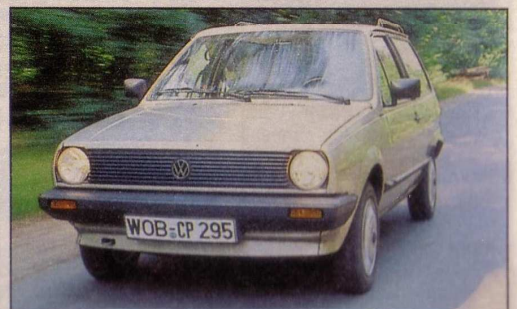
VW Polo CL D