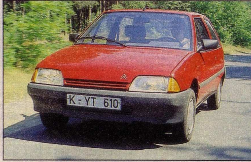
Citroën AX 14 RD