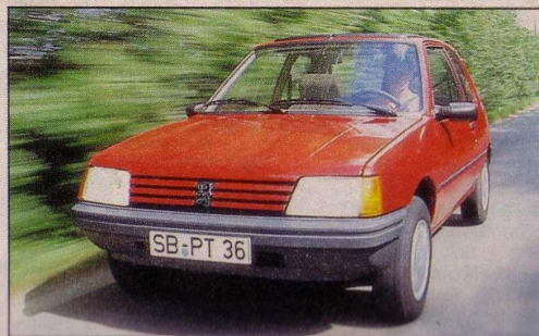
Peugeot 205 XLD