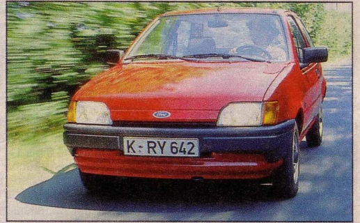
Ford Fiesta 1.8 D C